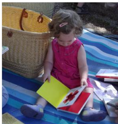
L'édition 2018 de Partir en livre à Valgorge

La médiathèque se fait également l'écho de certaines manifestations nationales autour de la lecture, et notamment Partir en livre , la grande fête du livre pour la jeunesse. Dans le cadre de cette manifestation, la Médiathèque proposera des animations familiales le mercredi 17 et le samedi 20 juillet prochains. À noter qu'à cette occasion, Valgorge accueillera la librairie ambulante Le Mokroule , le 17 juillet de 8h30 à 10h30. N'hésitez pas à découvrir cette librairie atypique, à profiter des conseils d'une librairie passionnée.