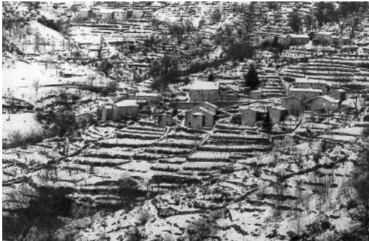
Les Abriges et ses faïsses cultivées hiver 1970

Aujourd'hui ne restent que quatre feux permanents sur le hameau.