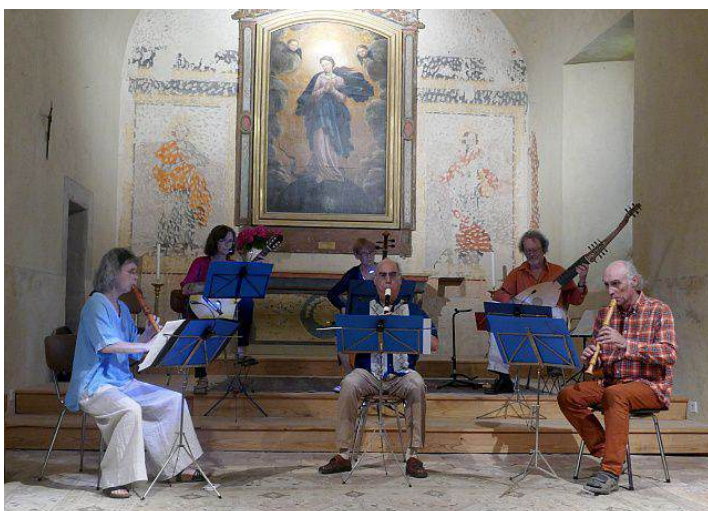
Ensemble baroque de Laboule