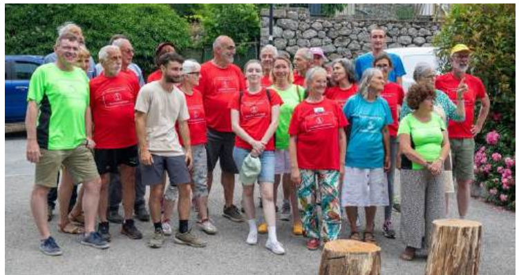
Quelques-uns des 76 bénévoles