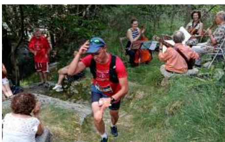
KV musical: au bord de la Dénave