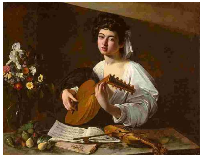
le Joueur de luth de Caravage