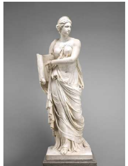
la Muse Calliope par Augustin Pajou

Venez nombreux: la musique vivante réveille l'ouïe!