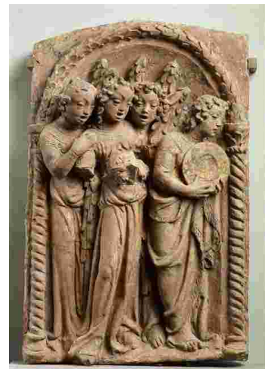
Donatello Les anges musiciens