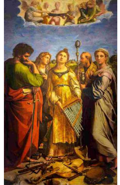
Raphaël L'extase de Sainte Cécile